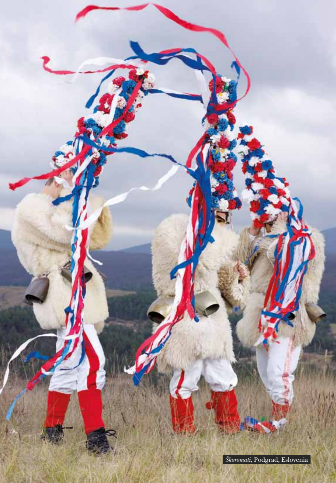
Škoromati, Podgrad, Eslovenia