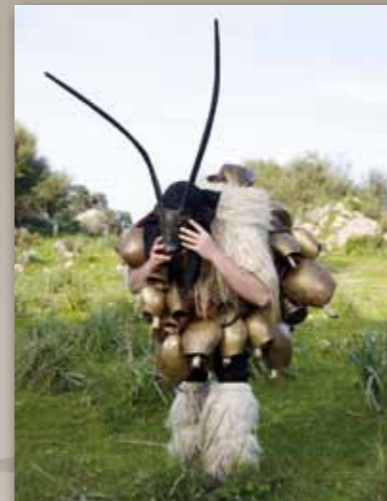
Boes, Ottana, Cerdeña, Italia