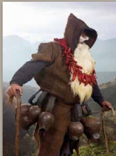
Djolomari, Begnishte, Macedonia