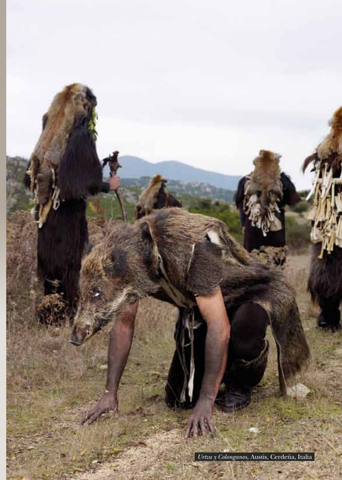
Urtzu y Colonganos, Austis, Cerdeña, Italia