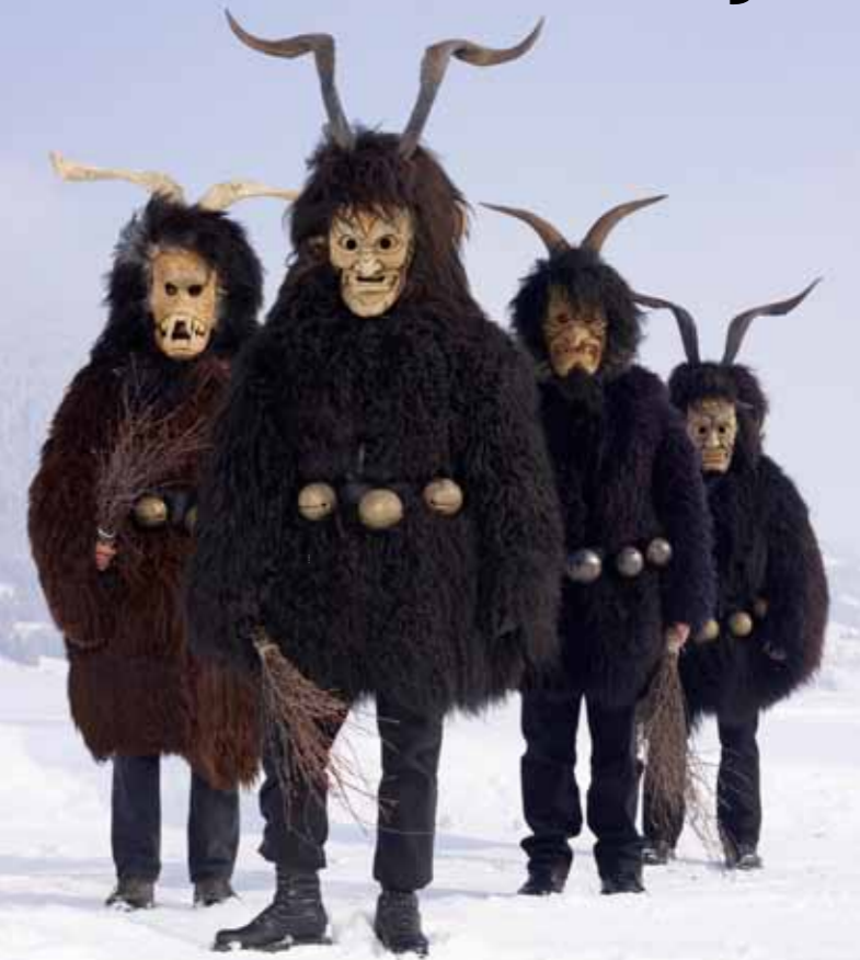
Krampus, Bad Mitterndorf, Austria

Inauteria Europako Erregea II Carnaval Rey de Europa II