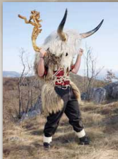
Dondolaši, Grobnick, Croacia