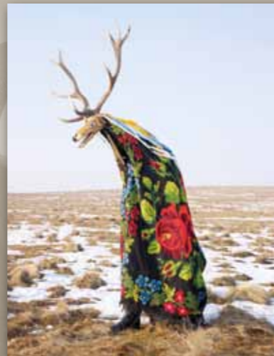
Cerbul (Cerf), Corlata, Rumania